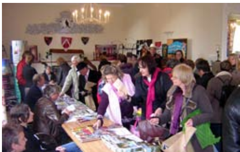
Convention de tourisme