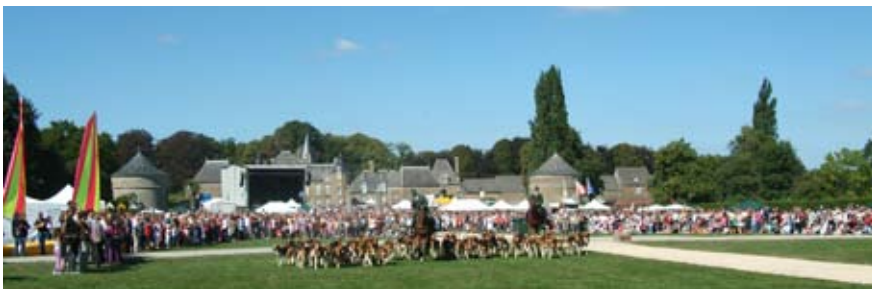
Journée CE et spectacle de la meute de chiens