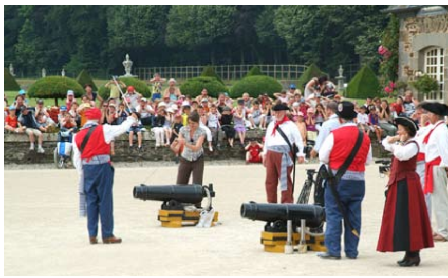
Journée CE avec animation «tirage de coup de canons»