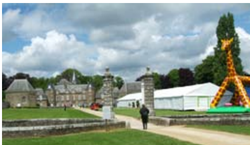
Lancement de produit