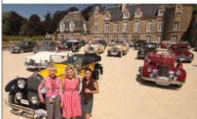
Rencontre internationale de l'association Packard