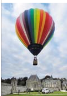
Incentive avec vol en montgolfière