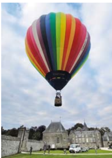
Incentive avec vol en montgolfière